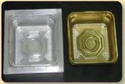
شكل (٢٣) قالب لصناعة الأدوات المنزلية.

ثانياً: من خلال دراستك لرموز من التراث العماني وبعد قراءتك للفقرة أجب عن الآتي: " تعتبر خامة الفحم من الخامات التي استخدمها الفنان البدائي في التعبير عن رسومه على أسطح الصخور "